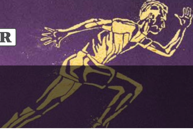
A biodisponibilidade do CAVAQ10® é 18 vezes maior que na CoQ10 convencional 7