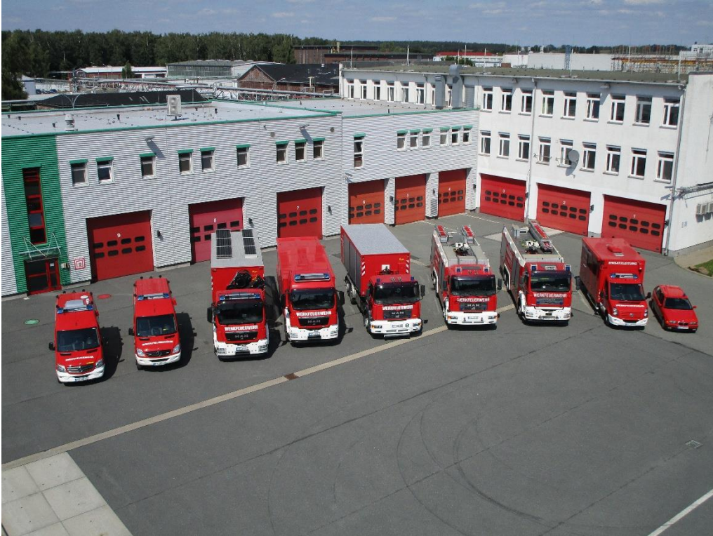
Bildunterschrift: Die Einsatzwagen der Werksfeuerwehr der Wacker Chemie AG Nünchritz stehen für die Jahresgroßübung bereit.

Eine jährliche Übung ist laut Anerkennungsbescheid der Landesdirektion Sachsen für die WACKER-Werkfeuerwehr vorgeschrieben. Geübt wird die enge Zusammenarbeit mit den Freiwilligen Feuerwehren der Gemeinde Nünchritz sowie der Freiwilligen Feuerwehr der Gemeinde Glaubitz. Außerdem nimmt die Schnelle Einsatzgruppe (SEG) der Johanniter Unfallhilfe an der Übung teil. Die Kräfte werden wie im realen Einsatzfall durch die Sirenen alarmiert. Je nach Szenario übernehmen die Freiwilligen Feuerwehren Aufgabenstellungen, die ihrer Ausrüstung und ihren Kompetenzen entsprechen. Die Gemeindefeuerwehren üben dabei die gemeinsame Kommunikation und die übergreifende Organisation während eines Einsatzes mit der Werkfeuerwehr.